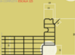
B1 DETALLE LADO B ESCALA 1:21