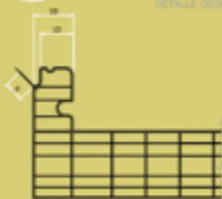
A1 DETALLE LADO A ESCALA 1:21